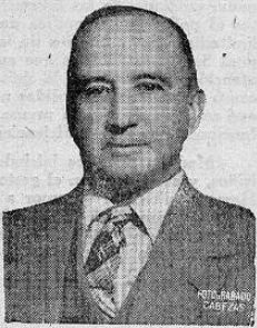
DON AQUILES BONILLA Ministro de Seguridad Pública

Bonilla, quien con su característica gentileza contestó a nuestras preguntas con las siguientes declaraciones.