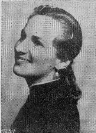
Sra. Karen Olsen de Figueres

En suntuosa recepción ofrecida en los salones de la Casa Amarrilla el pasado 30 de marzo, fue presentada al Cuerpo Diplomático acreditado ante nuestro Gobierno, La Primera Dama de la República Doña Karen Olsen de Figueres, esposa del Sr. Presidente don José Figueres Ferrer. La joven señora captó, por su